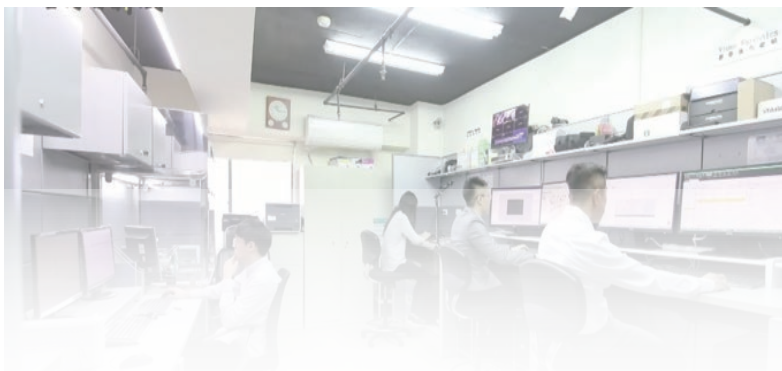
ISO/IEC 17025 專業數位鑑識實驗室